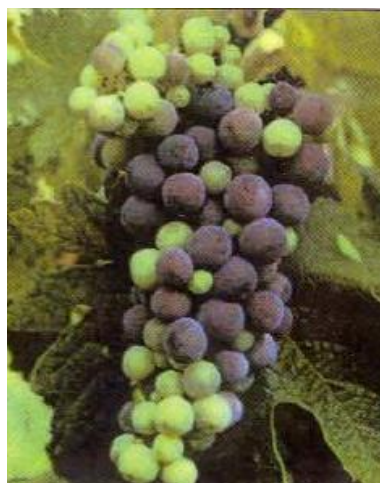
M2: Pleno envero

El momento óptimo (de media en Ribera del Duero para los últimos ocho años) en que habría de ser realizada esta labor de aclareo de racimos se sitúa en torno al 13 de agosto . Teniendo en cuenta todo lo anterior, así como que la cosecha a día de hoy presenta una gran irregularidad como consecuencia de las heladas acaecidas, es razonable conceder un período máximo de dos a tres semanas tras esa fecha para la realización del aclareo de racimos, por lo que el Pleno, en su reunión ordinaria de Consejo celebrada el día 28 de Julio de 2017, ha establecido que dicha práctica debe realizarse antes del jueves 5 (*) de septiembre de 2017 .