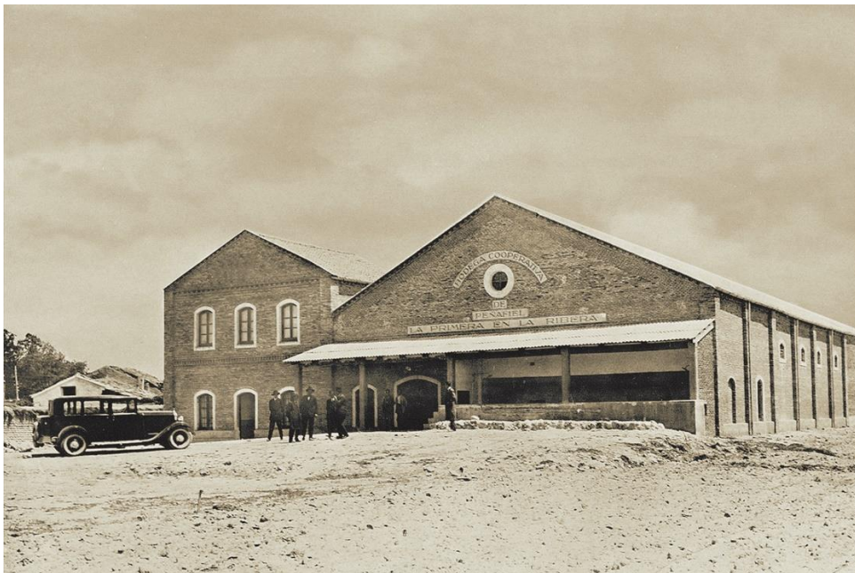
Imagen de la antigua cooperativa Protos Ribera del Duero de Peñafiel