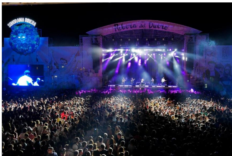
Escenario principal Ribera del Duero en Sonorama Ribera

El éxito de estos maridajes culturales abrió un mundo de acciones de apoyo al mundo de la cultura. En 2010, Ribera del Duero se unió a la Semana Internacional de Cine de Valladolid (Seminci), convirtiéndose en vino tinto o rosado oficial del festival de cine de autor. En 2019, Ribera del Duero pasó a ser Patrocinador Oro de este festival, convirtiéndose así en la única entidad de Castilla y León que ha alcanzado este estatus en la historia del festival , ampliando su presencia con la creación del Espacio Ribera y siendo sus blancos, tintos y rosados los vinos oficiales de la muestra. A partir de ese momento, el vino Ribera del Duero se convirtió en el elemento diferencial que marca y define a este festival. Un maridaje con el cine que se intensifica con la unión de Ribera del Duero al Festival Internacional de Cine de Sitges y a los Premios Feroz , del que ha sido vino oficial en las últimas cuatro ediciones.