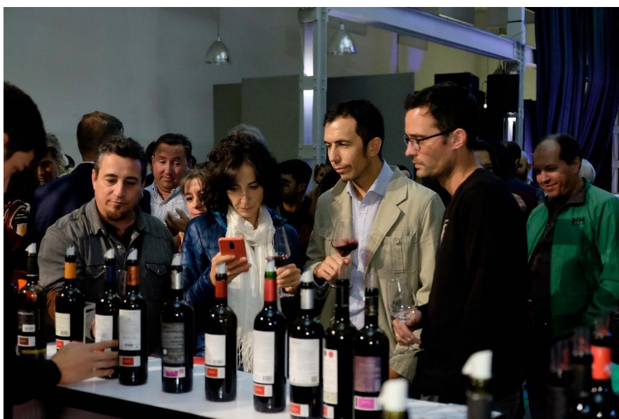
Imagen de wine bar de Ribera del Duero

Así nació, tras meses de trabajo incesante, la Denominación de Origen Ribera del Duero. Hoy es una marca de prestigio que ampara vinos reconocidos en todos los rincones del mundo. Hoy es motor económico y social de una comarca rural que agrupa pueblos de Soria, Segovia, Valladolid y Burgos. Hoy es emblema de Castilla y León y representante del buen hacer español. Y, sobre todo, hoy es compañera de brindis de quienes entienden que la vida siempre es mejor vivirla con vino y que este, el vino, es parte de nuestra forma de ser, de sentir, de disfrutar y de amar.