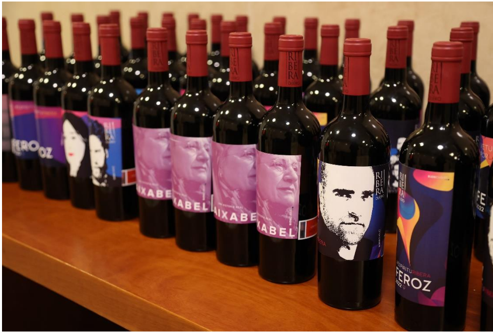
Ediciones exclusivas para Premios Feroz 2022

Ver etiquetas en: https://conriberasi.es/etiquetas-amigos/