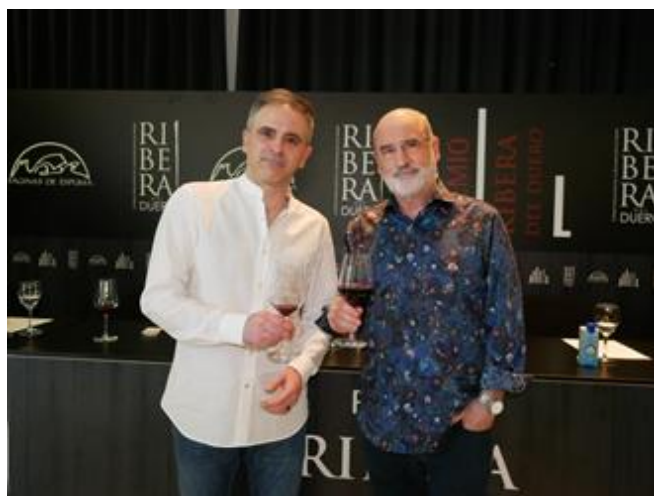
Últimas ediciones del Premio Ribera del Duero, con Almudena Grandes y Fernando Aramburu como presidentes del jurado.