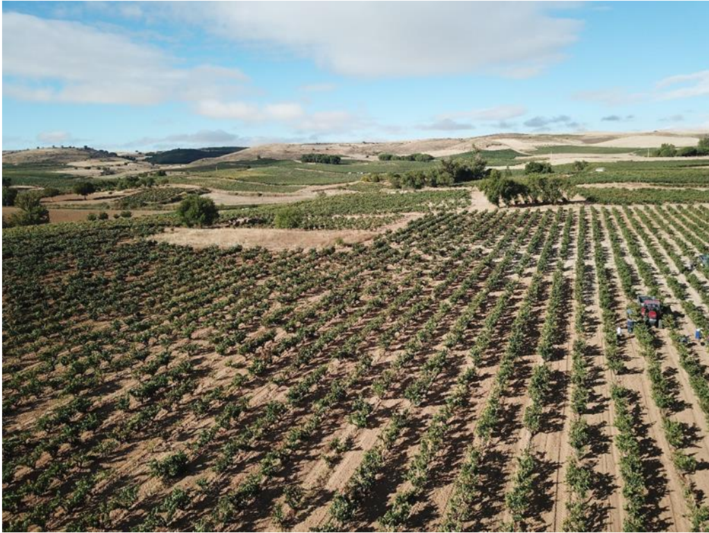
Vista panorámica de Ribera del Duero

El Consejo Regulador se implica también en todo lo relacionado con la protección y cuidado del medio ambiente, siendo las bodegas un ejemplo de sostenibilidad, con una viticultura responsable que minimiza el impacto ambiental, integrándose en el medio. La Ribera del Duero es ejemplo de viticultura, enología y producción sostenible, de compromiso con la naturaleza, con los consumidores y con el legado de las generaciones venideras.