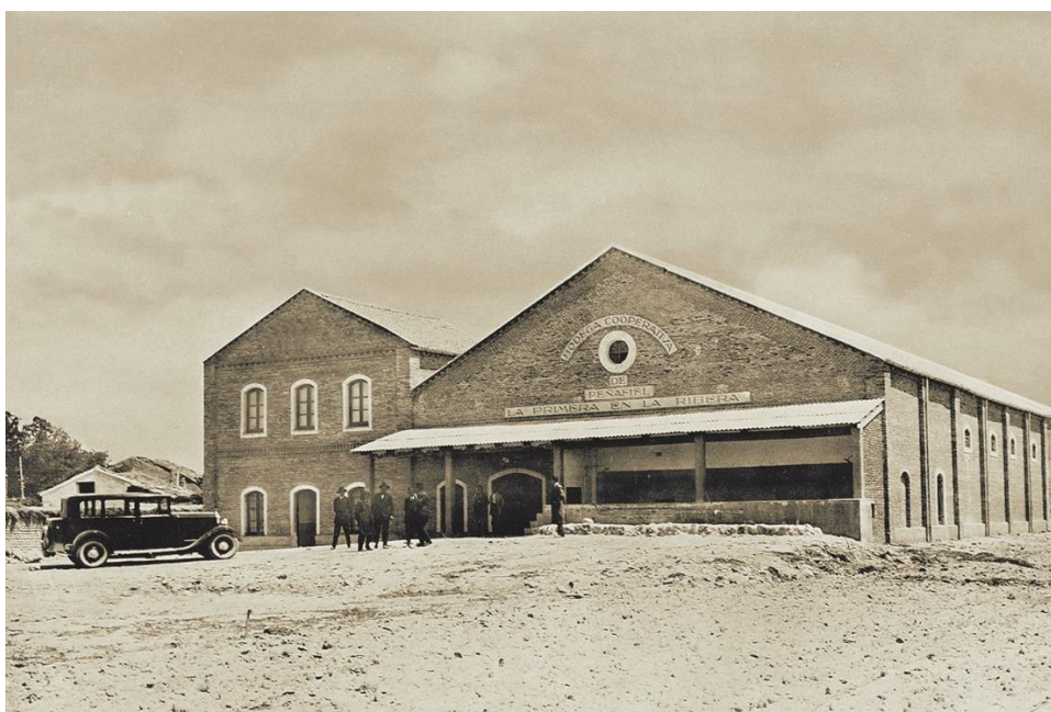
Imagen de la antigua cooperativa Protos Ribera del Duero de Peñafiel

llamarse desde los inicios Ribera del Duero, nombre registrado por la entonces cooperativa Protos de Peñafiel , que lo cedió gustosa sumándose de inmediato a la iniciativa. A mediados de los ochenta se unió también a un nombre histórico: Vega Sicilia . Y un poco después entró en escena Alejandro Fernández , que se sumó al grupo emprendedor impulsando de manera determinante la implicación del sector vallisoletano y contribuyendo además a la promoción de la marca de calidad.