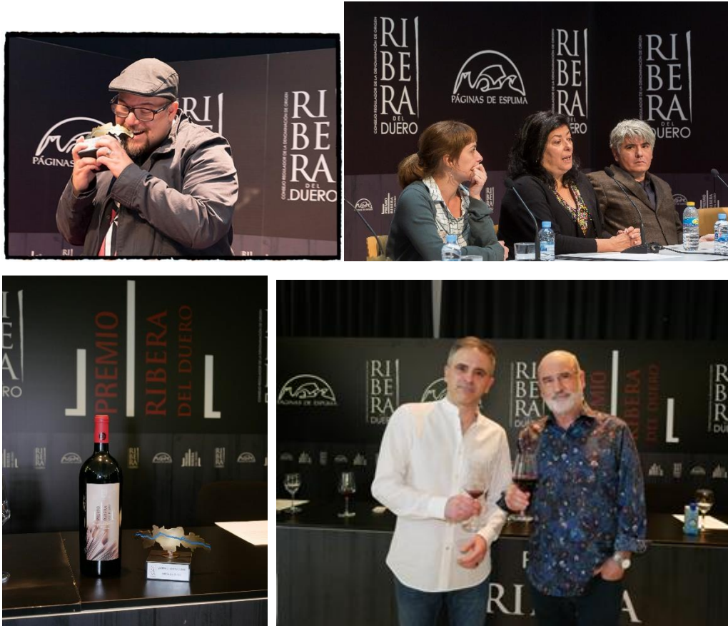
Últimas ediciones del Premio Ribera del Duero, con Almudena Grandes y Fernando Aramburu como presidentes del jurado.