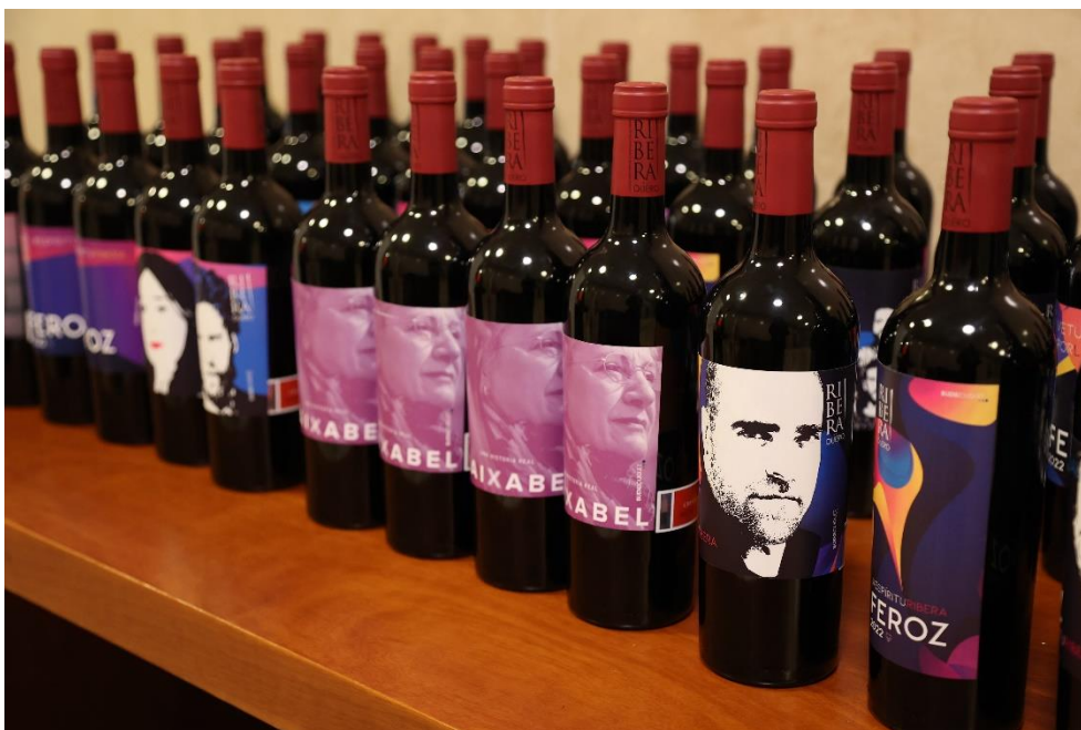
Ediciones exclusivas para Premios Feroz 2022

Artículos de coleccionista, con diseños exclusivos, que se entregan en el marco de festivales de cine, música o en momentos especiales del año a un selecto grupo de afortunados. Creaciones artísticas que homenajean la trayectoria profesional y reconocen el talento.